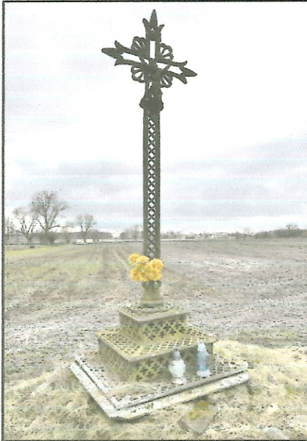
Żeliwny krzyż w Skarżynie

Liczne na terenie Polski kapliczki i krzyże przydrożne są materialnym świadectwem wierzeń, zwyczajów ale także wydarzeń historycznych, które upamiętniały wydarzenia, bardzo często o wymiarze jednostkowym, odnoszącym się do konkretnej rodziny czy postaci. Miejsce, w którym postawiono kapliczkę bądź krzyż nigdy nie było przypadkowe i zawsze miał swoje uzasadnienie. Kapliczki najczęściej mają charakter dziękczynny oraz błagalny. Ich fundatorami najczęściej byli mieszkańcy danej wsi, często pojedyncze osoby czy też rodziny ale także właściciele okolicznych ziem.