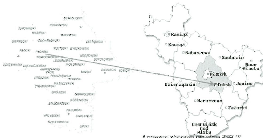
Rysunek 1. Położenie gminy Płońsk na tle województwa i powiatu