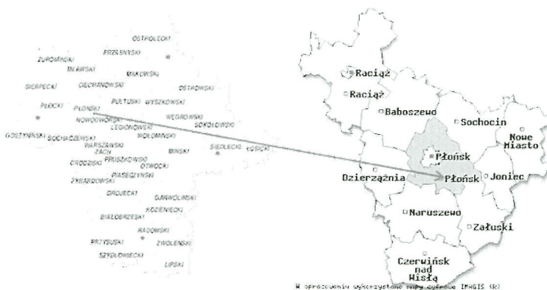
Rysunek 1. Położenie gminy Płońsk na tle województwa i powiatu