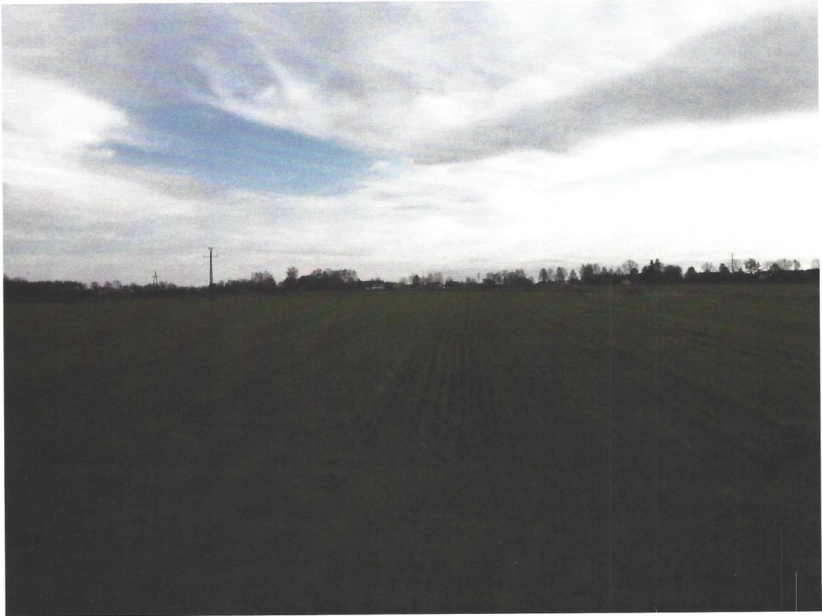
Obszar elektrowni oraz punkt i kierunek wykonania zdjęcia