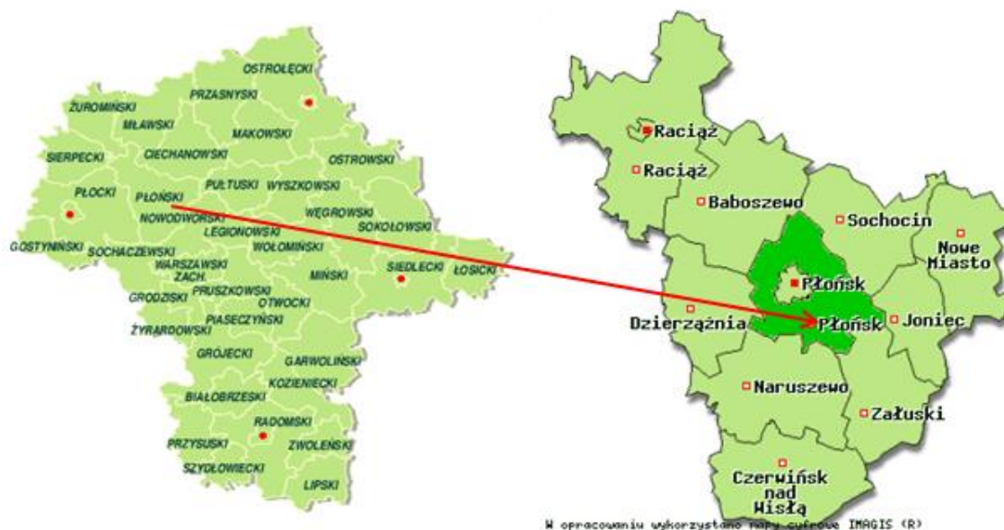
Rysunek 1. Położenie gminy Płońsk na tle województwa i powiatu